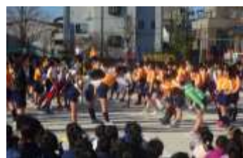
鼓笛移杖式を行いました。

太田小学校では、このようにして49年間、バトンをつないできました。バトンを渡してくれた6年生や卒業生にあこがれ、一步でも近づこうと努力をし、そのバトンを丁寧に次に渡す。それが伝統を築いていきます。ここまで太田小学校のバトンをつないでくれた6年生が、地域にはたくさん住んでおられます。本校の保護者の中にもおられます。