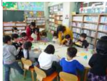
子どもからのリクエストで、学校図書館司書によるクリスマスツリー折り紙教室を行いました。(12/14・15 業間・昼休み)