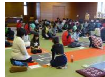
「彩の国 21世紀郷土かるた大会(岩槻区大会)」に太田小の児童が参加しました。(12月18日)

結びに当たり、今年1年間の地域の皆様方、保護者の皆様方のご理解とご支援に、心からお礼と感謝を申し上げます。本当にありがとうございました。良いお年をお迎えください。